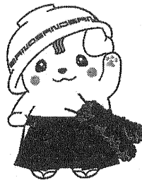
佐野ブランドキャラクター さのまる