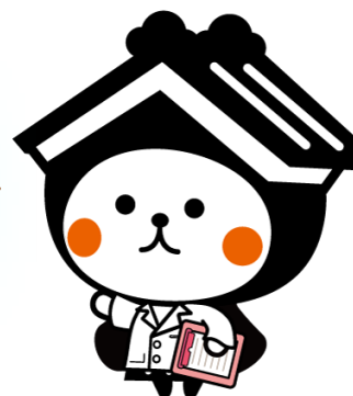
栃木市マスコットキャラクター 『とち介』