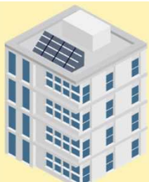
後期高齢者医療広域連合